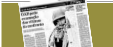
SEXTA, 29 DE JUNHO

Mas nossos governantes raramente formulam iniciativas consistentes para enfrentar as causas da criminalidade organizada e mal reconhecem que o controle legítimo da ordem é uma premissa para enfrentar o problema da insegurança em sua complexidade, avançando na direção de políticas de prevenção e de repressão democráticas. Preferem manter-se alheios ao funcionamento das redes de corrupção que envolvem diversos setores do poder público e que são potentes geradoras de violência. Resta saber até quando o custo político desse alheamento será menor do que o custo político do enfrentamento do problema. O custo social nós já conhecemos. ●